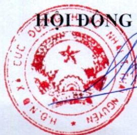
Nông Tiến Hải